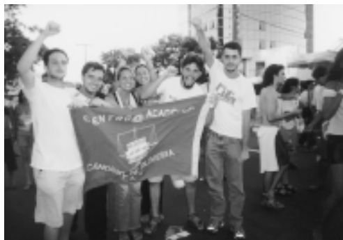
Representantes do CACO participam da Passeata pela paz