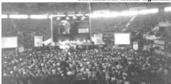
CACO participa de Conferência com Boaventura no estádio Gigantinho

Mais de 1.200 atividades foram realizadas, as quais se dividiram principalmente entre cinco eixos temáticos, conferências, painéis, testemunhos, seminários, oficinas, mesas de diálogo e controvérsias e ainda Fóruns Sociais pelo Mundo – espaços para os debates sobre os fóruns Sociais Regionais, Temáticos e locais.